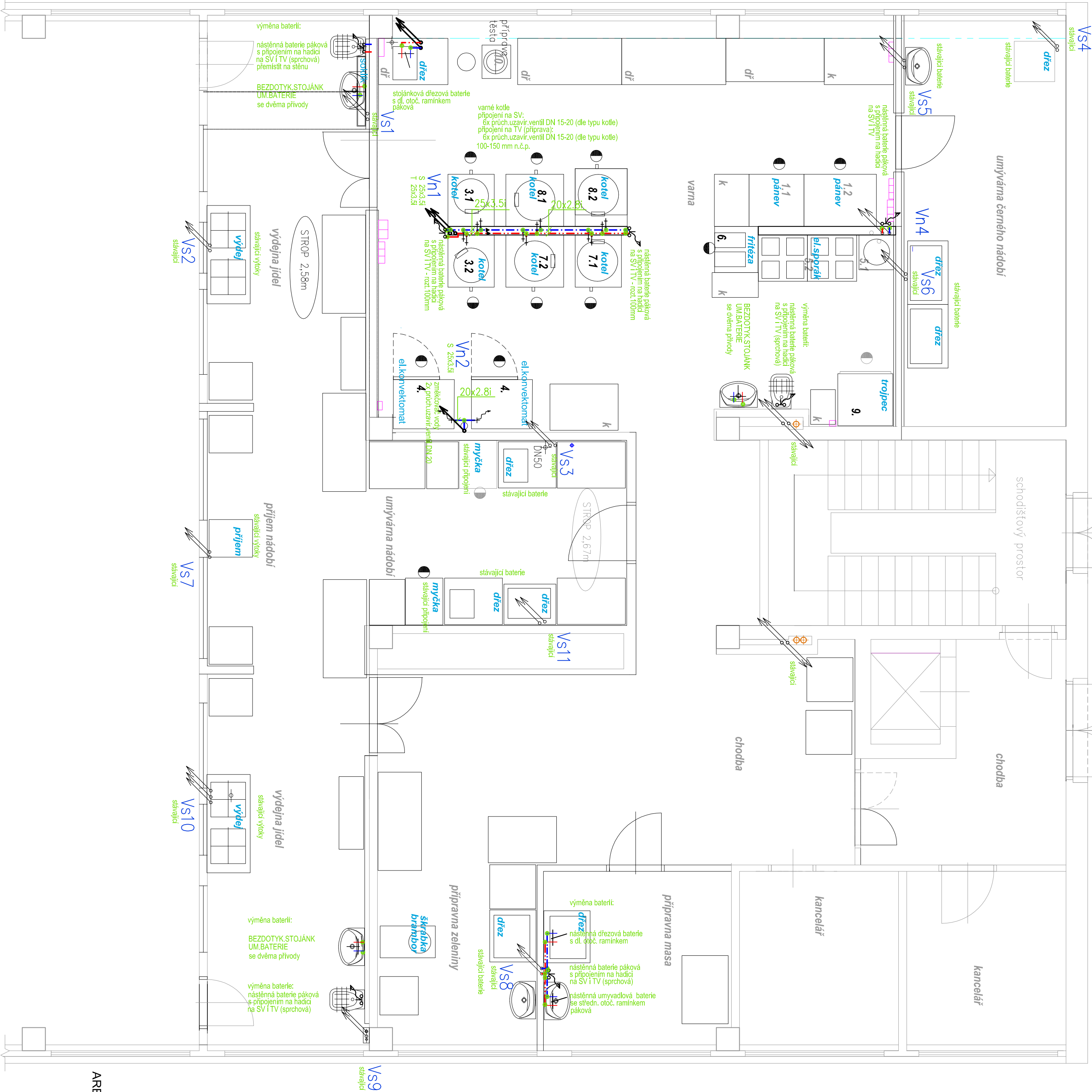
AREÁL II. ZŠ MILEVSKO-řešený objekt